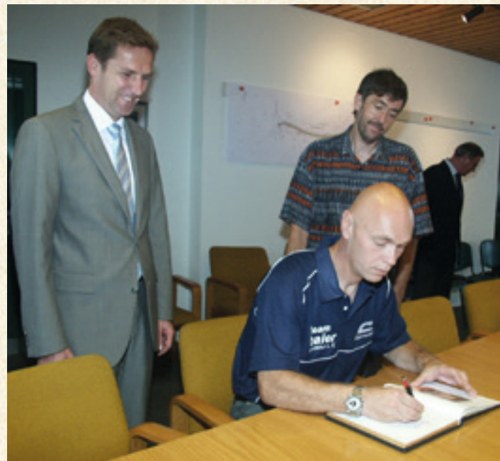
Beim Projekt XPer-Bike ging es darum, mehr Menschen im Landkreis Dingolfing/Landau zum Radfahren anzuspornen.