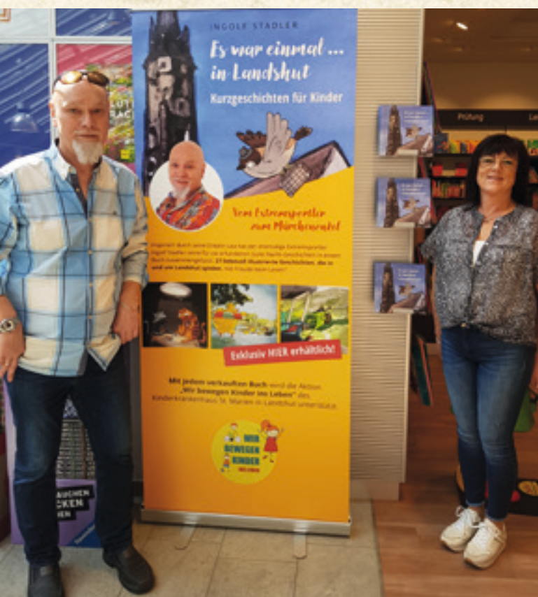
Seine Bücher kann man bei Bücher Pustet in Landshut kaufen.

Dafür bekommt er im Jahr 2018 noch einmal eine Gelegenheit, sich auf großer Bühne zu beweisen – ganz wortwörtlich: Denn in diesem Jahr spielt er eine Statistenrolle als einer der „schweren Jungs“ im Kinofilm „Und morgen die ganze Welt!“, der 2020 veröffentlicht und vielfach prämiert worden ist.