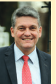
Peter Forstner, Erster Bürgermeister