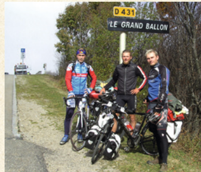
Kurze Verschnaufpause am Ziel

ma am Fuß eines Berges steht und sich denkt ‚Des schaff i ned‘, dann schaff mas a ned. Man muss a ned glei mit großen Zielen anfangen, sondern kann sich erstmoi kleinere Etappenziele setzen.“ Dass sein Körper die Weiterfahrt verweigert hätte, sei nicht vorgekommen. Wobei er zugibt, dass er heute zu seinem ehemaligen Ich sagen würde: „I glaub, du spinnst a bissl.“