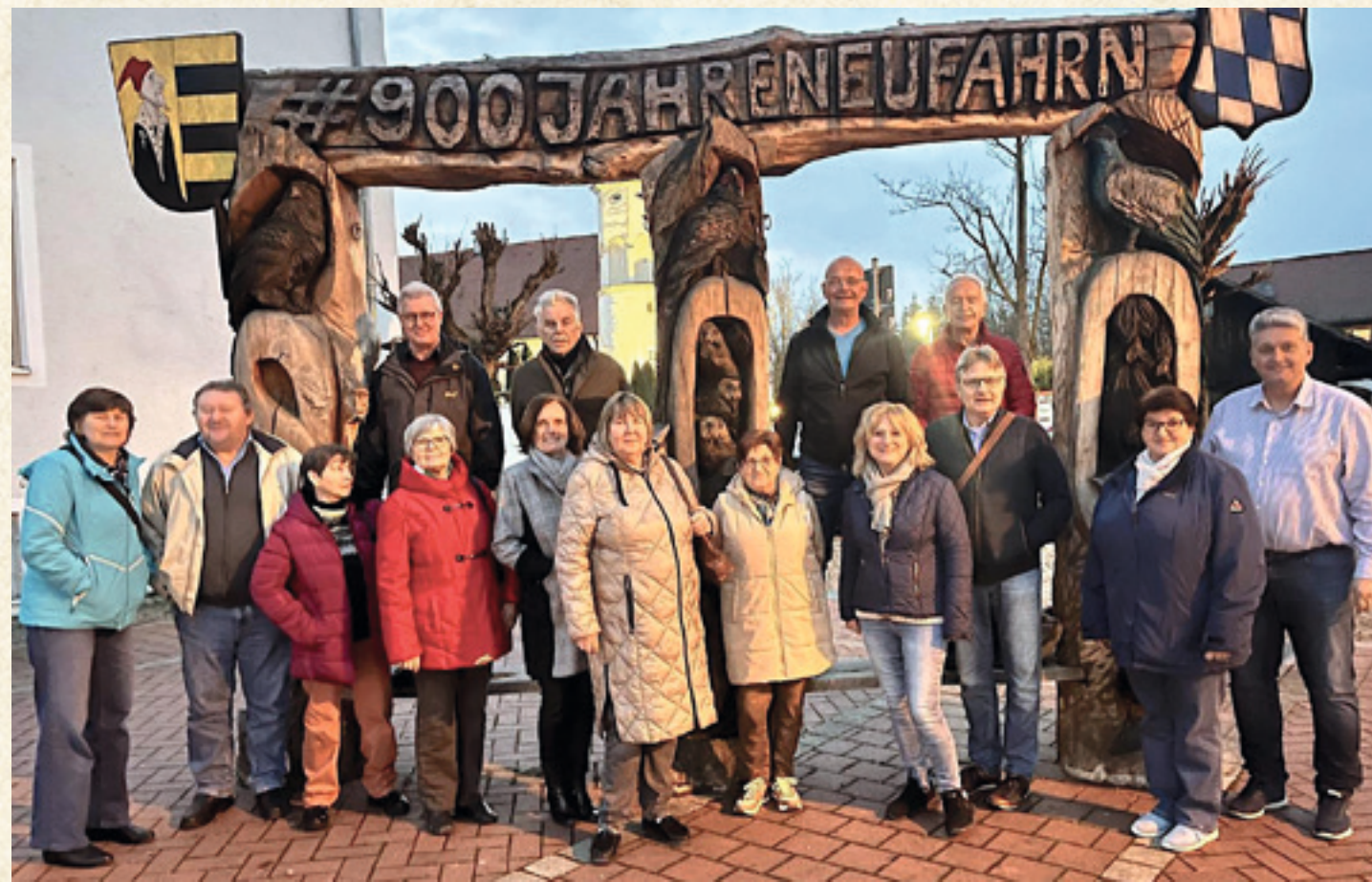
Die Mitglieder der Nachbarschaftshilfe Neufahrn