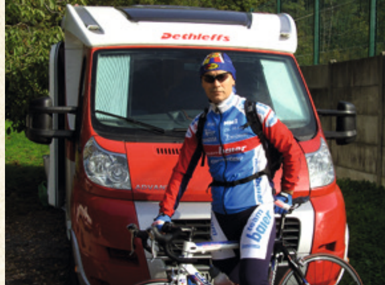
Auf seiner „Iberia 2002“-Tour schläft er in einem Wohnmobil.